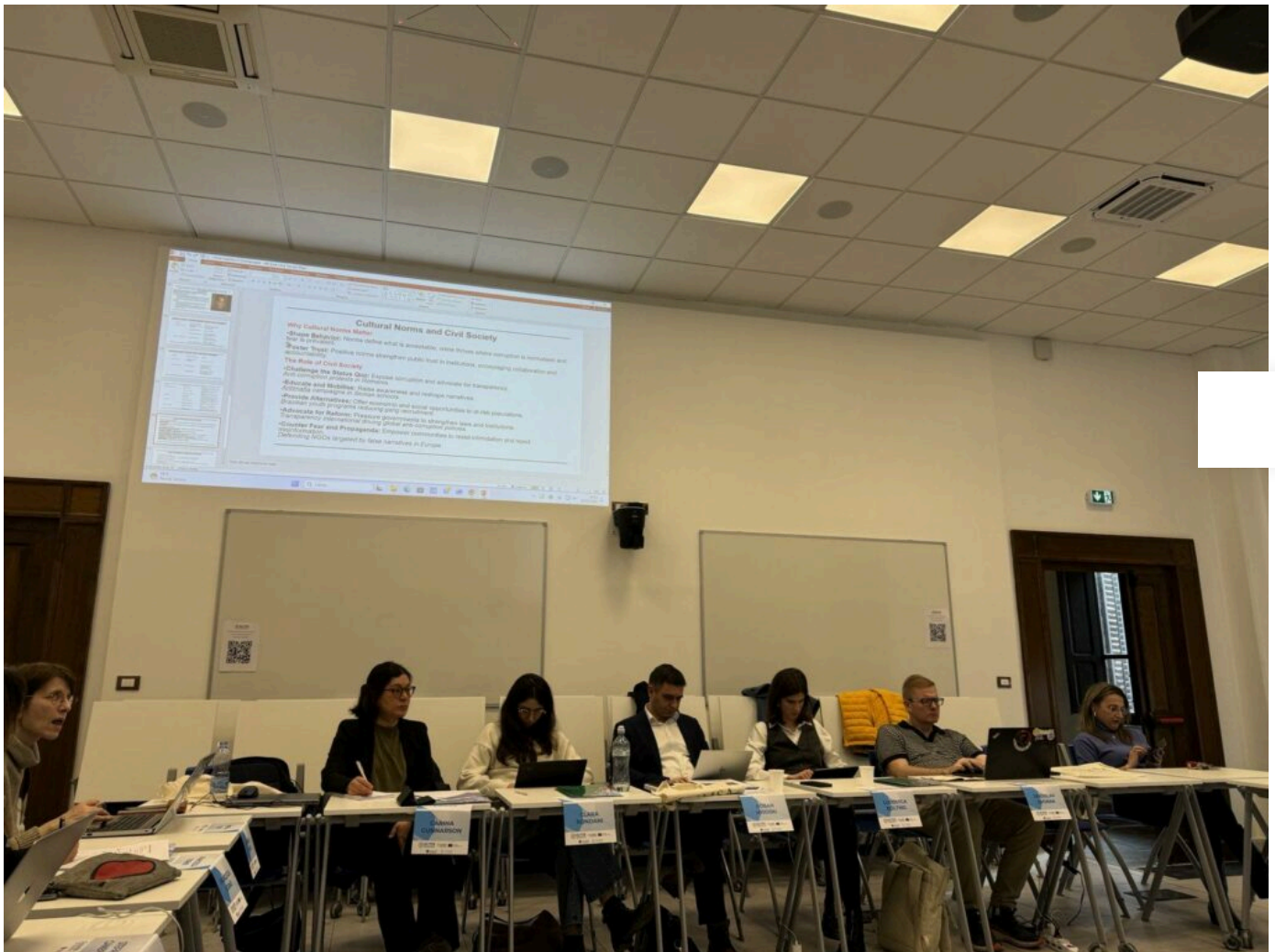
Фотозвіт GLITTS workshop «Civil Society's Responses to Illicit Trade», м. Палермо, 06–07.02.2025 р.