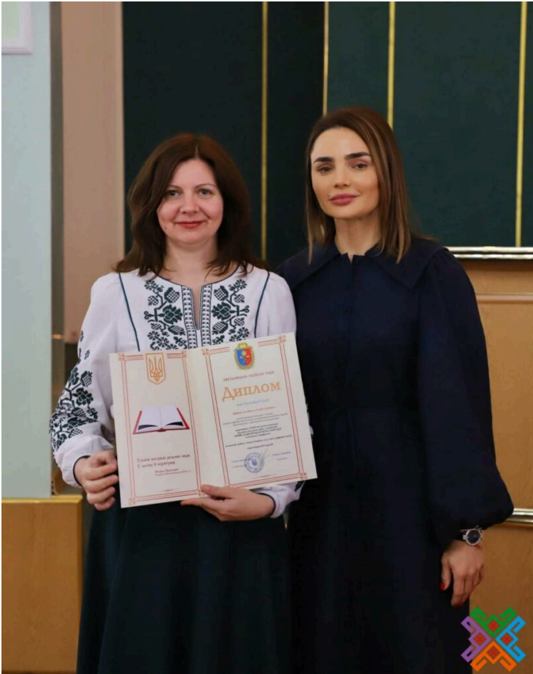
Джерело: Хмельницька обласна рада