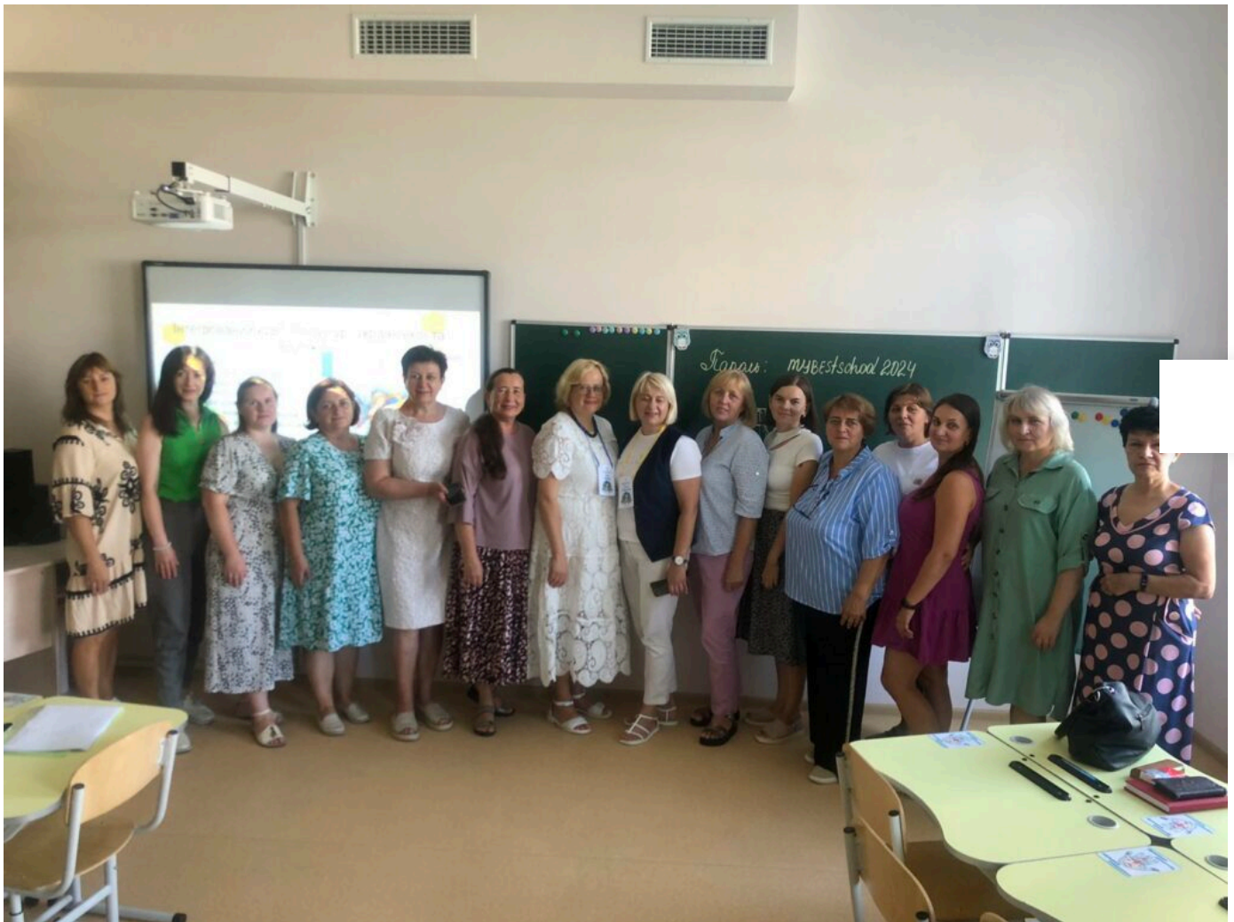
Інформація кафедри української філології

Загальні питання: centr@khnmu.edu.ua Подача новин та анонсів: press@khnmu.edu.ua