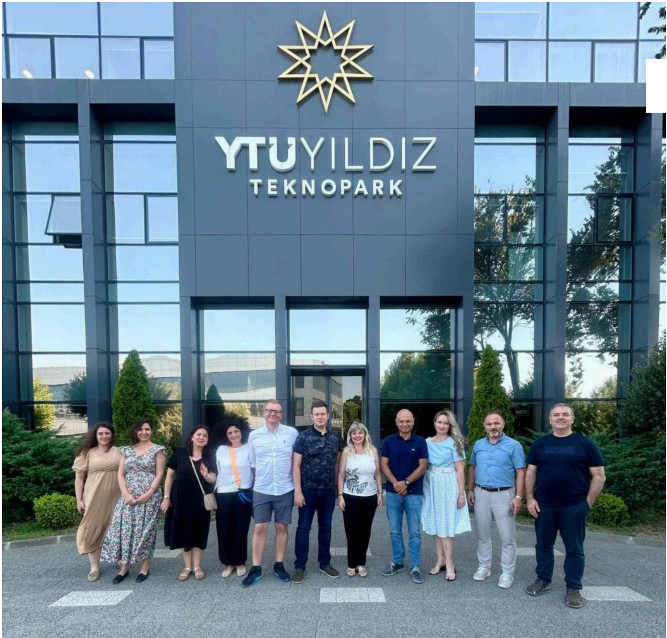
Протокольне фото учасників GLITTS workshop «Migrant workers, the unnoticed side of the workforce – evaluation in terms of legality and other aspects», м. Стамбул, 22.07.2024 р.