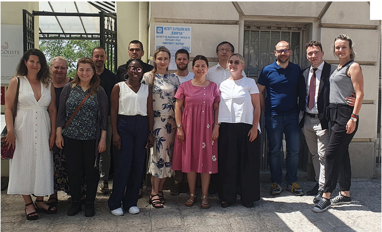
Протокольне фото учасників GLITTS workshop «The Role of Technology in Combating Illicit Trade», м. Белград, 10.07.2024 р.