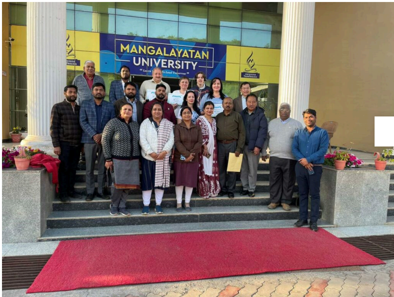
Кафедра економіки, аналітики, моделювання та інформаційних технологій в бізнесі, кафедра вищої математики та комп'ютерних застосувань

Загальні питання: centr@khmnu.edu.ua Подача новин та анонсів: press@khmnu.edu.ua