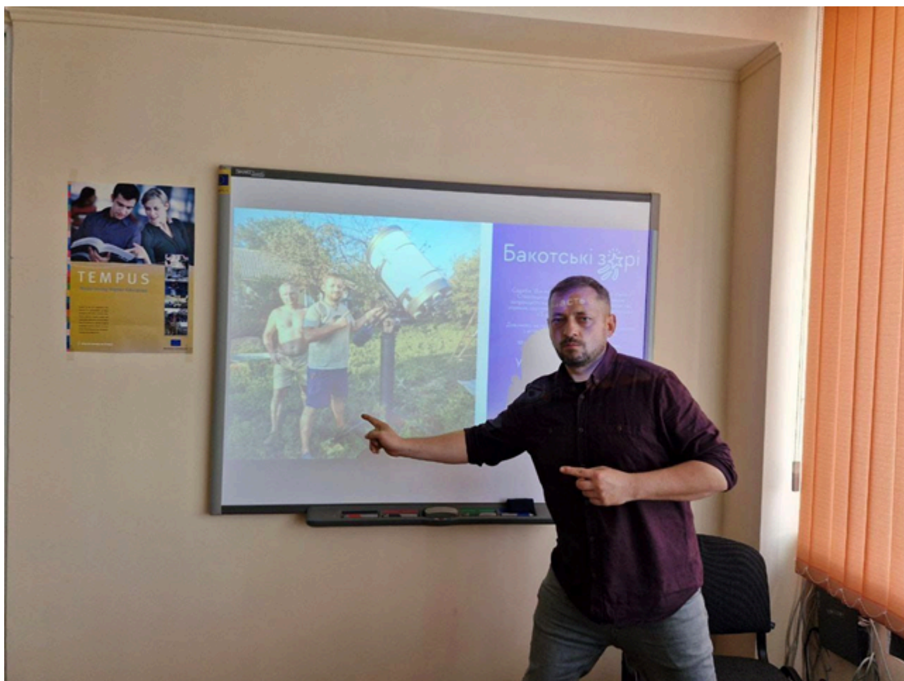
Інформація кафедри туризму та готельно-ресторанної справи