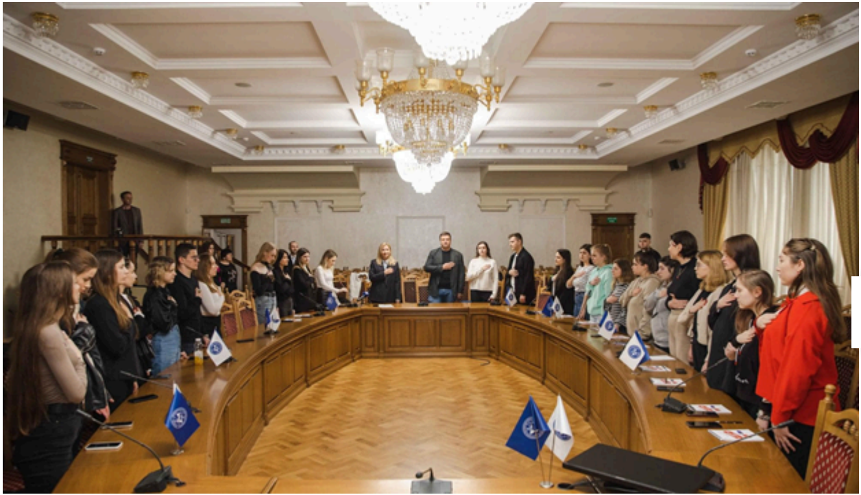
Кафедра екології та біологічної освіти

Загальні питання: centr@khnmu.edu.ua Подача новин та анонсів: press@khnmu.edu.ua