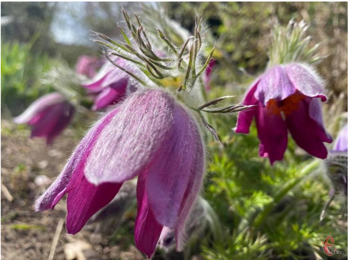
Сон занесений до Червоної книги України.

1 Травня, 2021 Ірина ОЛІЙНИК Суспільство 3866